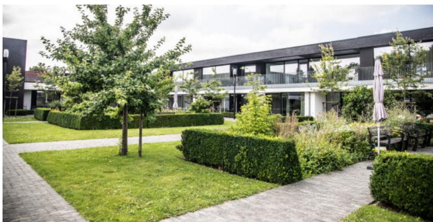
Heerlyckheid Hoog Mosscher

Een woonassistent staat tot jouw dienst voor vragen in verband met hulp- en dienstverlening. En je kan beroep doen op extra zorg zoals Thuiszorgdienst Phebe, Familiehulp, kinesithérapie, ... Er is ook de mogelijkheid om te genieten van een dagverse maaltijd van wzc De Pottelberg; samen in het restaurant of geleverd in je eigen flat. Je kan ook bij ons terecht wanneer je behoefte hebt aan een gesprek rond levensvragen. Bewoners die niet langer in de flat kunnen verblijven omdat ze permanent hulp nodig hebben, krijgen voorrang bij een opname in het woonzorgcentrum.